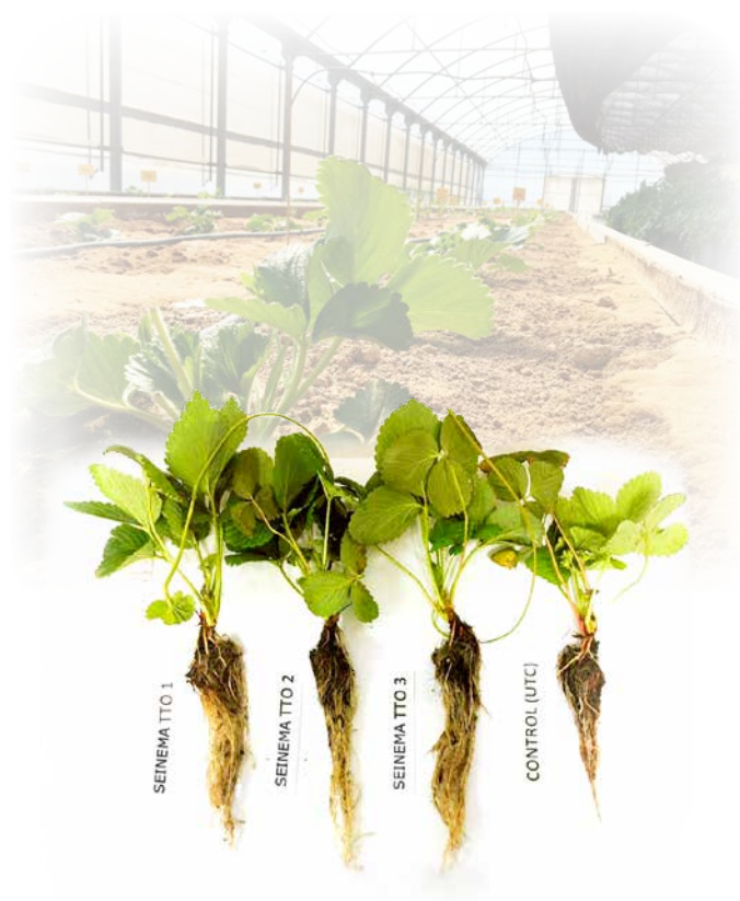
Ensayo con Seinema® en cultivo de fresa en semillero.

Activa el desarrollo radicular y vegetativo