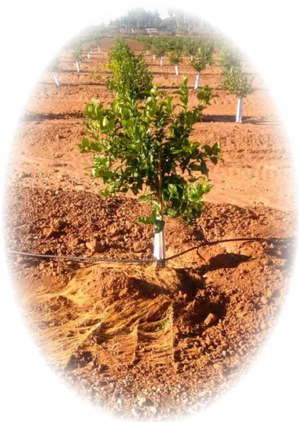
Seinema®: formación radicular en plantación de cítrico joven.

Seinema® es una formulación que activa los procesos biológicos del suelo y las raíces. Su aplicación favorece la actividad microbiana del suelo y consigue un mayor desarrollo y protección del sistema radicular frente a factores abióticos, así como una mejor absorción de nutrientes. Seinema® permite obtener un rápido desarrollo vegetativo, precocidad de establecimiento y una rápida entrada en producción.